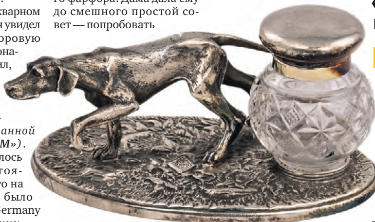
Чернильница с фигурой собаки изготовлена в Англии в XX веке

Несмотря на множество редких экспонатов, в коллекции Леонида Бельского пока нет настоящей римской чернильницы. Он ее давно ищет, но достойного экземпляра найти не случилось. — Сейчас у меня есть точные копии римских чернильниц, но я надеюсь рано или поздно пополнить коллекцию настоящей чернильницей времен Древнего Рима, когда правил Цезарь.